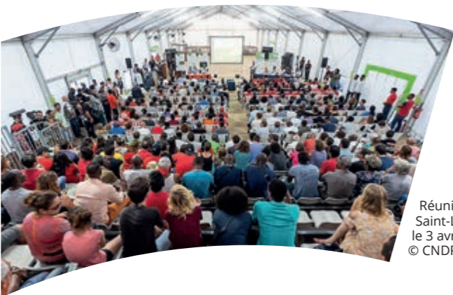
Réunion publique Saint-Laurent-du-Maroni le 3 avril 2018